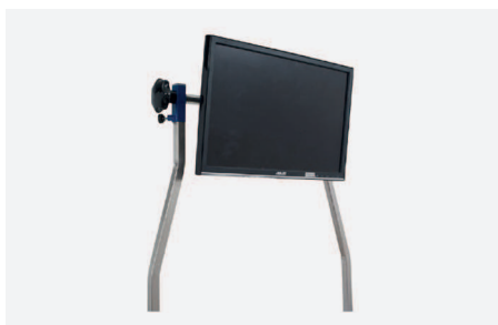
MASZT Z UCHWYTEM DO MONITORA W 2170

Do wieszania monitorów komputerowych lub paneli LCD dla ekranów o przekątnej 8-22 cali. Płynna regulacja na boki, w górę i w dół oraz regulowany kąt nachylenia monitora. Dopuszczalne obciążenie 80 N/8kg