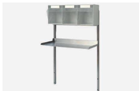
PÓLKA DOSTAWIANA GÓRNA W 2530

Ze stali kwasoodpornej z dozownikiem czteroskrzynkowym na materiały opatrunkowo-zabiegowe. Skrzynki uchylne w wymiarze (szer. x gł. x wys.) 130x125x190mm. Wysokość półki nad blatem roboczym 280mm. Wymiary półki (szer. x gł.) 590x280mm