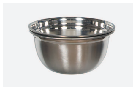
UCHWYT DO MISKI NA ODPADY W 2260

Zawieszany na szynie sprzętowej nr kat. W2020 • średnica uchwyty 180mm • regulowana w zakresie 5mm