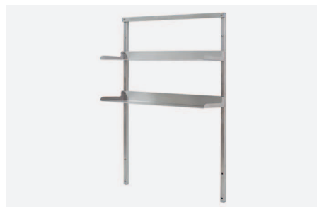
PÓLKI DOSTAWIANE GÓRNE W 2430

Ze stali kwasoodpornej na stelażu z szynami montażowymi do akcesoriów specjalistycznych. Wysokość półki nad blatem roboczym 280mm. Wymiary półki (szer. x gł.) 590x280mm.