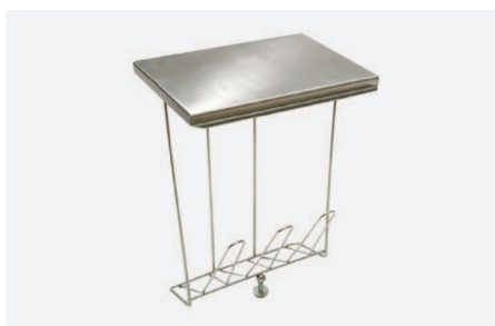
STELAŻ Z POKRYWĄ DO WORKA NA ODPADY MIĘKIE O POJ. 10L W 2240

Zawieszany na szynie sprzętowej nr kat. W2020 . Pojemność worka 8l.