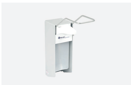
DOZOWNIK DO ŚRODKÓW DEZYNFEKCYJNYCH W 2230

Zawieszany na stelażu nr kar. W 2420 lub szynie sprzętowej nr kat. W2020 . Wymiary (szer. x gł. x wys.) 240x80x200mm. Wewnątrz ruchoma przegroda pionowa, dzieląca wnętrze na trzy komory.