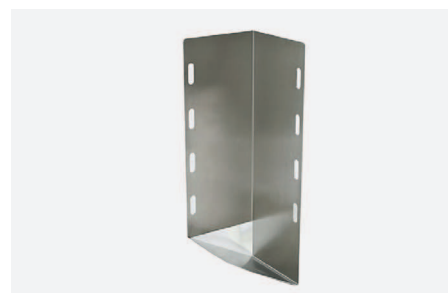
UCHWYT DO BUTLI Z TLENEM O POJ 10L W 2290

Zawieszany na szynie sprzętowej nr kat. W2020