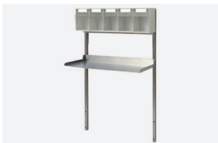
PÓLKA DOSTAWIANA GÓRNA W 2510

Ze stali kwasoodpornej zamocowane na stelażu metalowym z szyną montażową do akcesoriów specjalistycznych wysokość dolnej półki nad blatem roboczym 280 mm. Wymiary półki (szer x gł) 590 x 280 mm.