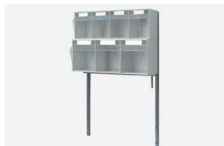
ZESTAW DOZOWNIKÓW W 2630

Pięć i czteroskrzynkowych na materiały opatrunkowo-zabiegowe na stelażu metalowym. Dane techniczne dozowników skrzynkowych jak pozycje W 2510 i W 2520 .