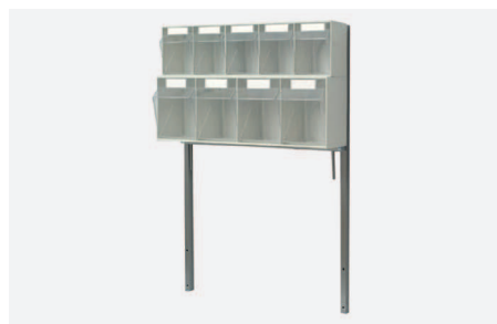
ZESTAW DOZOWNIKÓW W 2620

2 x czteroskrzynkowych na materiały opatrunkowo-zabiegowe na stelażu metalowym. Dane techniczne dozowników skrzynkowych jak pozycja W 2520 .