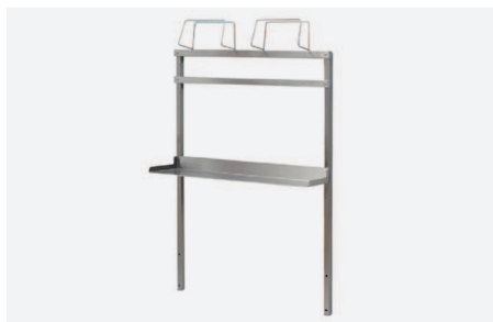
PÓLKA DOSTAWIANA GÓRNA Z DWOMA UCHWYTAMI NA POJEMNIKI DO RĘKAWICZEK W 2420

Ze stali kwasoodpornej, zamocowana na stelażu metalowym. Wysokość półki nad blatem roboczym 280mm. Wymiary półki (szer. x gł.) 590x280mm