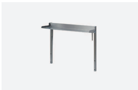
PÓLKA DOSTAWIANA GÓRNA W 2410

Ze stali kwasoodpornej, zamocowana na stelażu metalowym. Wysokość półki nad blatem roboczym 280mm. Wymiary półki (szer. x gł.) 590x280mm