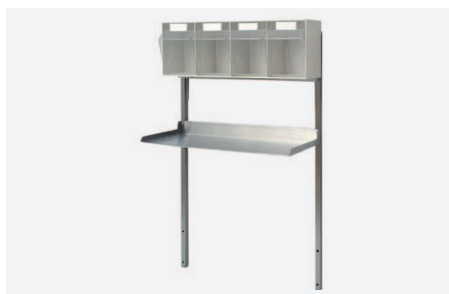
PÓLKA DOSTAWIANA GÓRNA W 2520

Ze stali kwasoodpornej z dozownikiem pięcioskrzynkowym na materiały opatrunkowo-zabiegowe. Skrzynki uchylne w wymiarze (szer. x gł. x wys.) 100x95x145mm. Wysokość półki nad blatem roboczym 280mm. Wymiary półki (szer x gł.) 590x280mm.