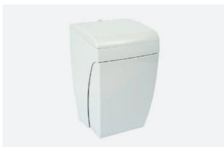
KOSZ Z SYSTEMEM OTWIERANIA KOLANOWEGO W 2270

Zawieszany na szynie sprzętowej nr kat. W2020 • średnica miski 200mm