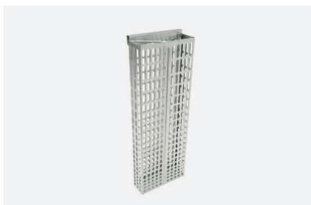
POJEMNIK NA CEWNIKI W 2210

Do wieszania monitorów komputerowych lub paneli LCD dla ekranów o przekątnej 8-22 cali. Płynna regulacja na boki, w górę i w dół oraz regulowany kąt nachylenia monitora. Dopuszczalne obciążenie 80 N/8kg