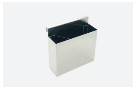
POJEMNIK NA KLESZCZYKI W 2220

Zawieszany na szynie sprzętowej nr kat. W 2020 . Wymiary (szer. x gł. x wys.) 180x60x500mm. Wewnątrz ruchoma przegroda pionowa, dzieląca wnętrze na trzy komory.