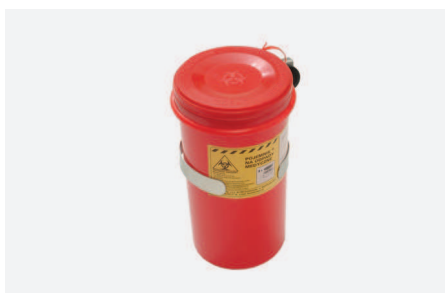
UCHWYT Z POJEMNIKIEM NA ZUŻYTE IGŁY W 2250

Zawieszany na stelażu nr kat. W2420 , lub szynie sprzętowej nr kat. W2020 . Dostawa nie obejmuje płynu myjąco-dezynfekcyjnego.